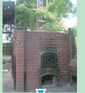
丸五市場で Lunch time